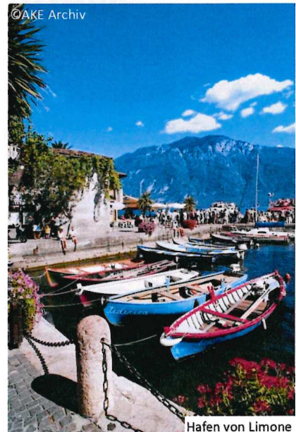
Hafen von Limone