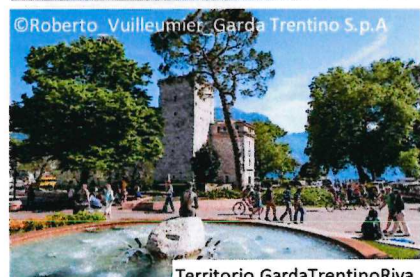
Territorio Garda Trentino Riva