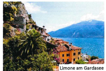
Limone am Gardasee

Nach dem Frühstück erfolgt die Rückreise im 1. Klasse-Sonderzug AKE-RHEINGOLD ab Steinach am Brenner nach Berlin.