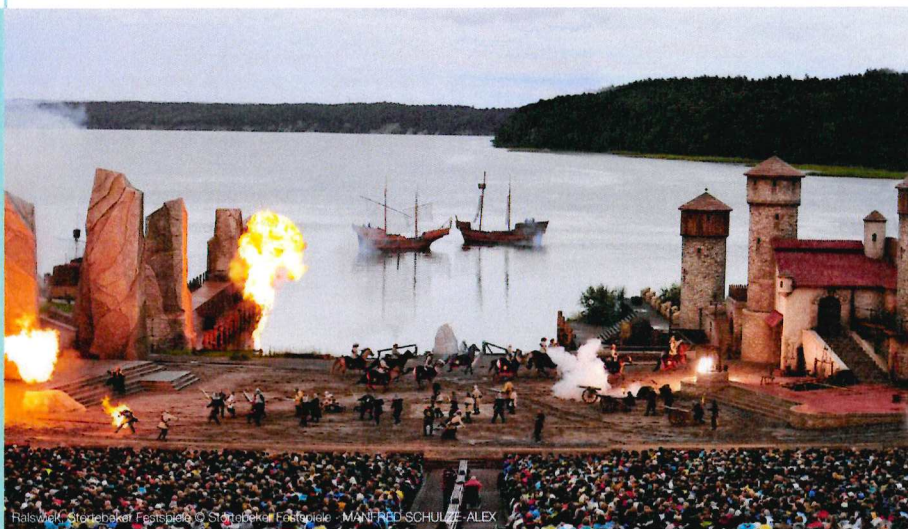
Ralswiek, Störtebeker Festspiele