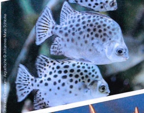
Stralsund, Ozeaneum - Argusfische