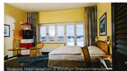
Stralsund, Hotel HanseDom