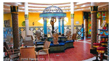
Stralsund, Hotel HanseDom

WEITERE HOTELEINRICHTUNGEN Des Weiteren verfügt das Hotel über ein Restaurant, Wellness-Bereich „HanseDom“ sowie über Aufzüge.